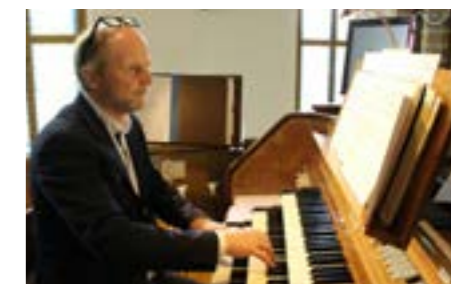
Orgelresitasjon og pasjonsgudstjeneste i Vestre Aker langfredag 19. april.