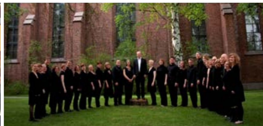
Vestre Aker kammerkor

En tirsdager i måneden inviterer vi 10. klassinger til Tacotirsdag kl. 15-17 i Vestre Aker menighetshus. Vi spiser sammen, og kommer du litt tidlig kan du være med å lage mat også. Her er det mulighet til å henge, gjøre lekser om det trengs, og snakke med venner og ledere. Datoer finner du på nettsidene våre.