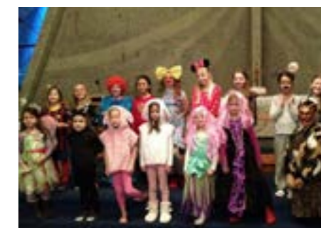
Karnevalgudstjeneste i Bakkehaugen 17. mars.