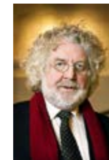
Edvard Hoem er gjestetaler på nærmiljøgudstjeneste i Bakkehaugen 3. mars.